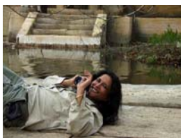
Deepa Mehta, Directora