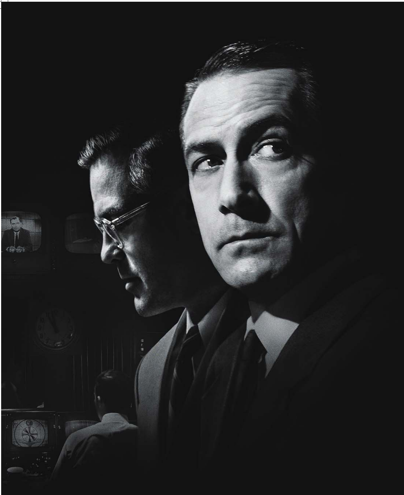
Buenas Noches, Buena Suerte/Good Night and Good Luck Estados Unidos/USA