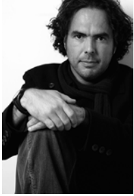
Alejandro González Iñárritu, Director