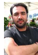
Israel Adrián Caetano. Director

Israel Adrián Caetano nació en Montevideo, Uruguay. A los 16, se mudó a Argentina y comenzó a dirigir cortometrajes. En 1997, co-dirigió su primera película, Pizza, Beer and Cigarettes (Pizza, Cerveza y Cigarrillos), que fue un enorme éxito de crítica y comercial en Argentina. Sus dos próximas obras, Bolivia (01) y A Red Bear (02), ganaron numerosos premios internacionales. Chronicle of an Escape (Crónica de una Fuga) (06) es su película más reciente.