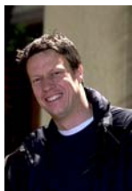
Gavin Hood, Director

Nacido en Joanesburgo, Sudáfrica, Gavin Hood estudió en la Universidad de Witwatersrand y la Universidad de California, Los Angeles. Dirigió piezas dramáticas con fines educativos para el Departamento de Salud Educativa de Sudáfrica antes de dirigir su primer cortometraje, The Storekeeper, en 1998. Su primer largometraje fue A Reasonable Man, el cual también coprodujo, escribió y en el que actuó. Sus otros largometrajes son In Deser (en polaco), Wilderness y Tsotsi.