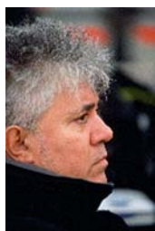
Pedro Almodóvar, Director