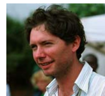
Kevin Macdonald, Director

Kevin Macdonald nació en Glasgow y estudió en la Universidad de Oxford. Es periodista, escritor, director y productor. Su documental One Day In September (99) ganó un Academy Award como mejor documental del 2000. Sus otras películas incluyen Chaplin's Goliath (96), A Brief History of Errol Morris (99), and Touching The Void (03). El Ultimo Rey de Escocia es su film más reciente.