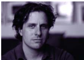
Davis Guggenheim, Director