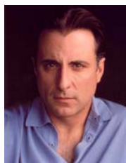
Andy Garcia, Director