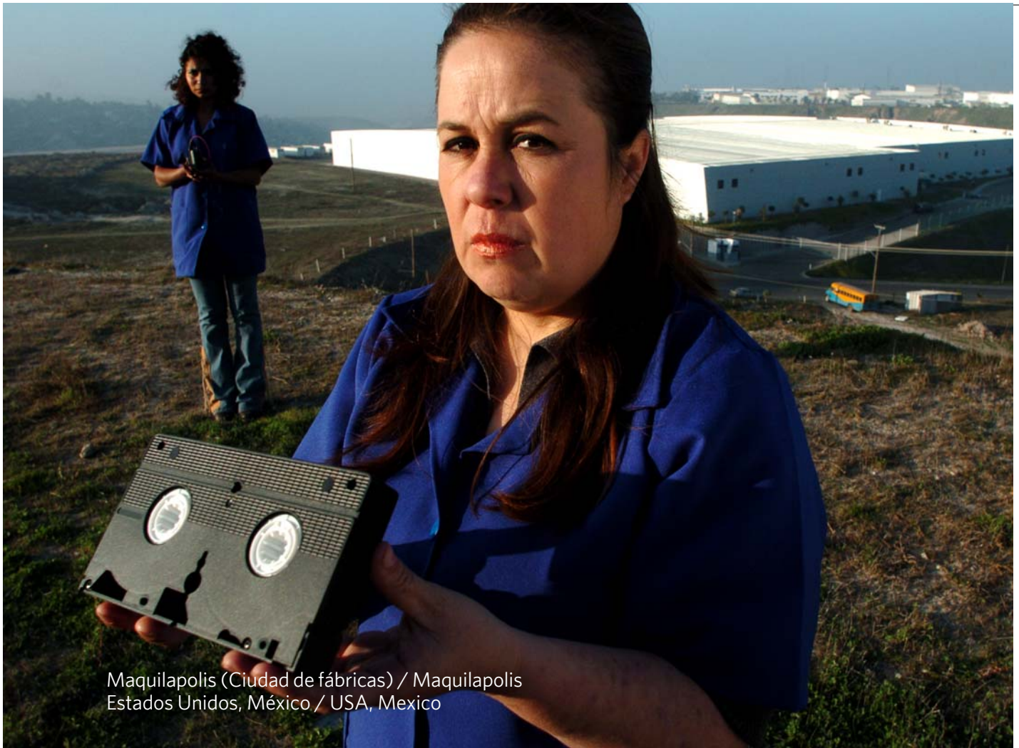
Maquilapolis (Ciudad de fábricas) / Maquilapolis Estados Unidos, México / USA, Mexico

Coordinadora de Boletería / Box Office Coordinator