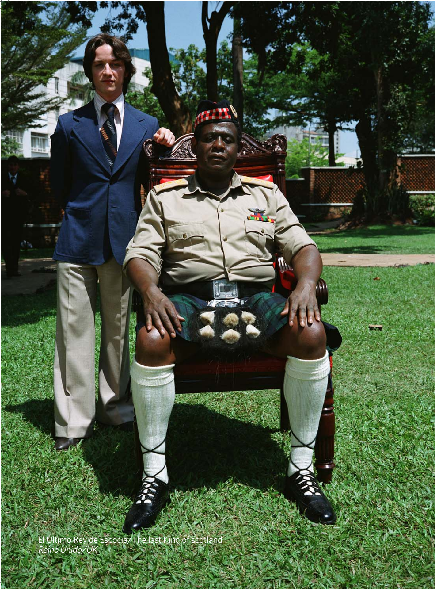
El Último Rey de Escocia / The Last King of Scotland Reino Unido / UK