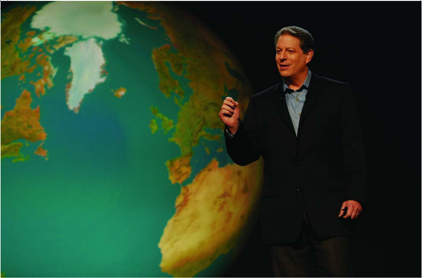
An Inconvenient Truth, Al Gore