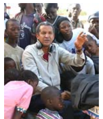
Abderrahmane Sissako, Director

Abderrahmane Sissako nació en Kiffa, Mauritania y fue criado en Mali. Después de estudiar en el Instituto Estatal Ruso de Cinematografía en Moscú, dirigió varios cortometrajes, incluyendo Octubre (93) y Sabriya (96), seguidos por el documental Rostov-Luanda en 1997. Sus largometrajes incluyen La Vie sur terre (98), y Waiting For Happiness (02), y Bamako (06).